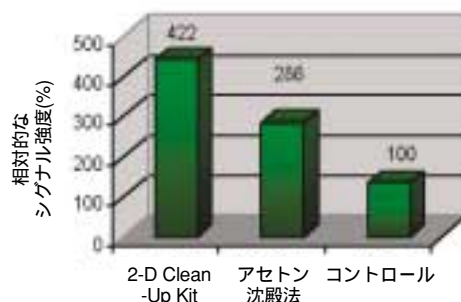
図1. 標識効率の違い

タンパク質サンプルを、2-D Clean-Up Kitまたはアセトン沈殿法により処理を行い、コントロール(未処理サンプル)と比較しました。サンプルをCy5で標識して泳動後染色したゲルを解析した結果、2-D Clean-Up Kit処理サンプルが非常に高い効率で標識されたことがわかりました。